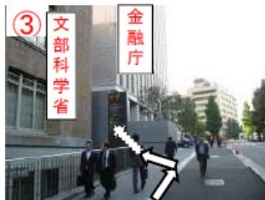
③ 文部科学省と金融庁の間にある車庫入口 手前の階段を上る