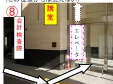
⑧ 講堂入口から入りエレベータで 講堂に向かう