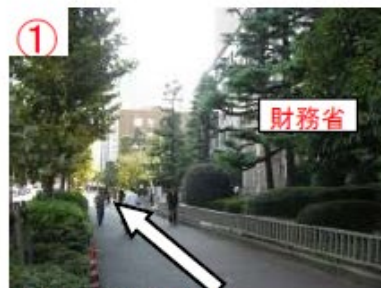
① 霞ヶ関駅A13番出口 (財務省を右手に直進)