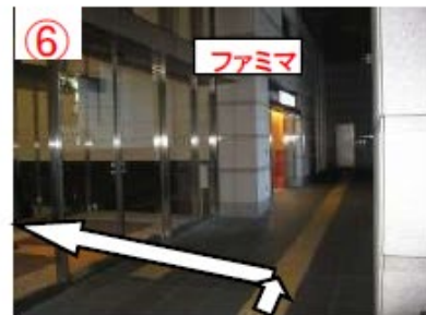
⑥ ファミリーマート手前の自動ドアから入る