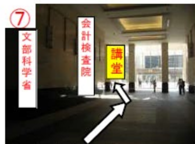
⑦ 左奥に講堂入口がある (この位置からは見えない)