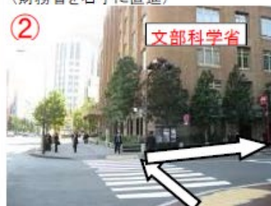
② 交差点を右折(写真の建物は文部科学省)