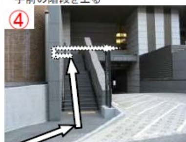
④ 階段を上り、自動ドアへ向かう