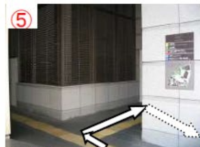
⑤ 階段を上ったところ